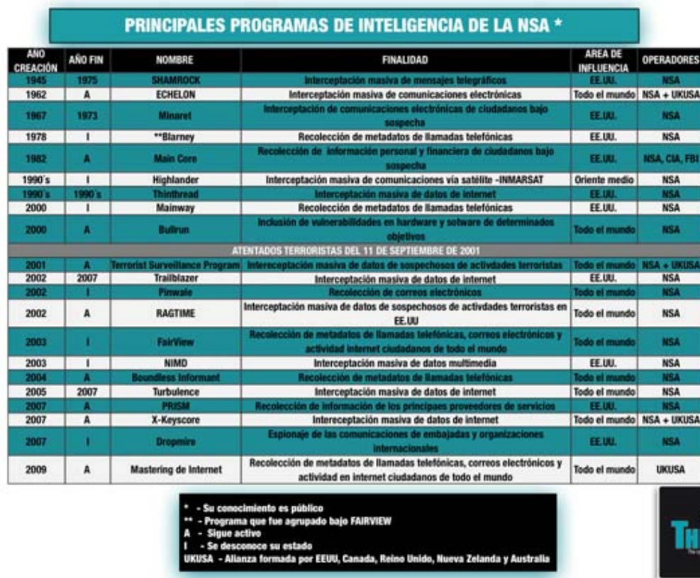
Figura 1. Principales programas de vigilancia y espionaje ejecutados por la NSA