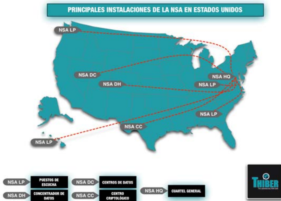
Figura 2. Principales instalaciones de la NSA en territorio estadounidense

A partir de 2001, la NSA ha ampliado sus instalaciones a lo largo y ancho del país y en la actualidad dispone de cuatro grandes centros de escuchas en EEUU: Oahu, Hawaii; Grovetown, Georgia; Sugar Grove, West Virginia; y Yakima en Washington que, según algunas fuentes, podría haberse cerrado a principios de 2013. Además, dispone de dos grandes centros de procesamiento de datos: uno en Buckley, Colorado, y otro recién inaugurado en Camp Williams, Utah, así como de un centro criptológico en San Antonio, Texas. Todas estas instalaciones están conectadas con la sede central en Fort Meade y constituyen lo que la jerga especializada se denomina el “pulpo” (la NSA surveillance octopus ) que recoge el mapa en la Figura 2.