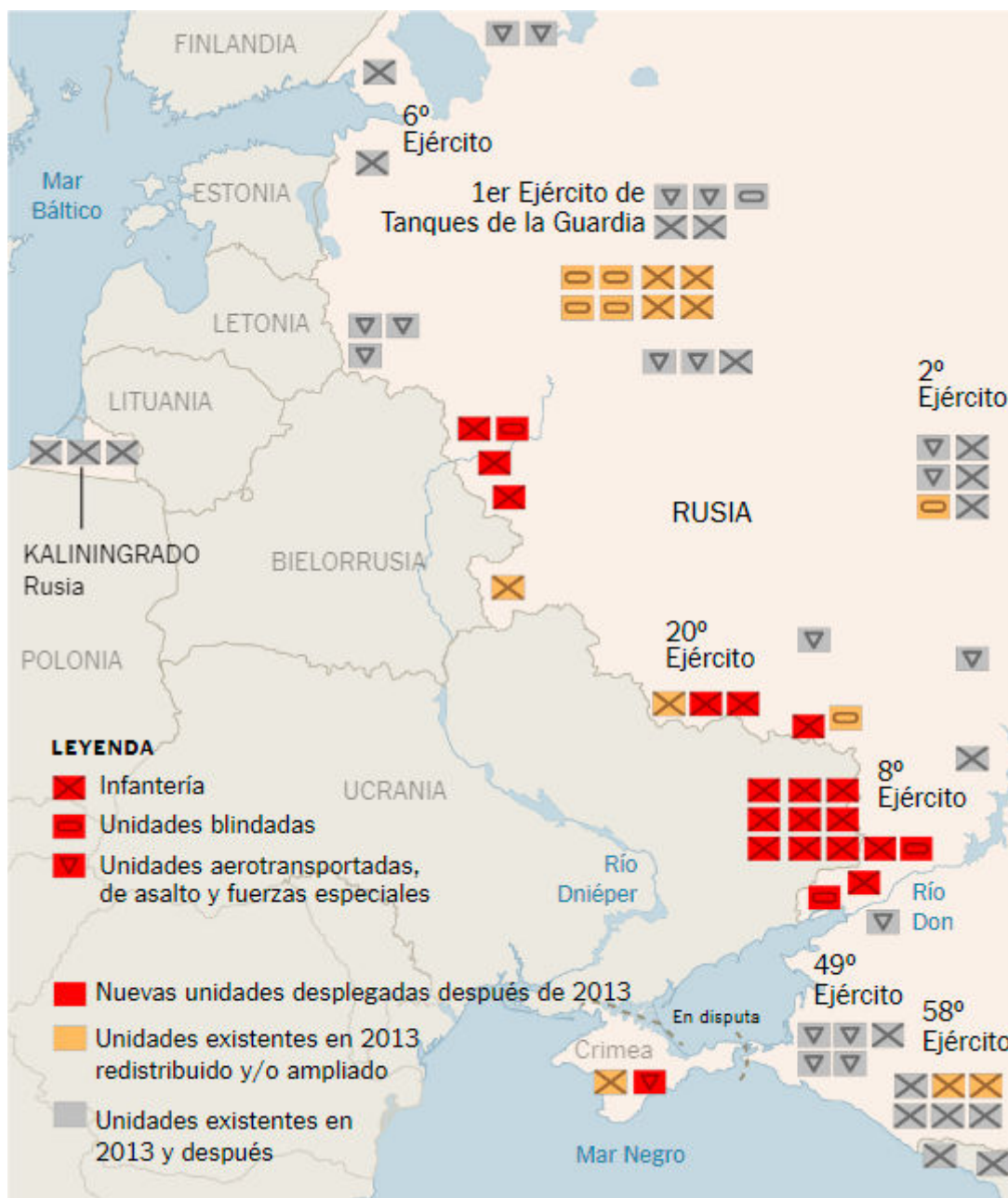
Figura 1. Zapad-2017: dónde, cuándo, cómo y por qué

Fuente: P.A. Karber, Fundación Potomac. Mapa: New York Times.