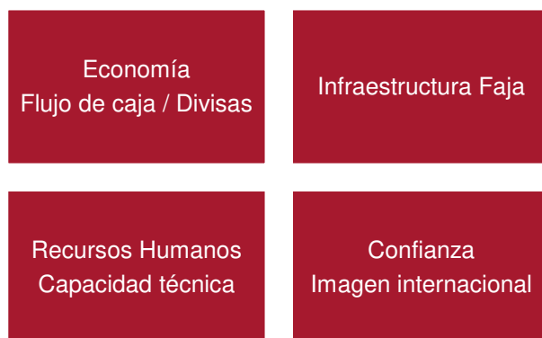
Figura 2. Principales retos de PDVSA

gobierno estadounidense, combinado con la falta de pago de los compromisos internacionales por parte de PDVSA, han destrozado la calificación crediticia de la empresa, incrementando el coste de endeudamiento a niveles inviables.