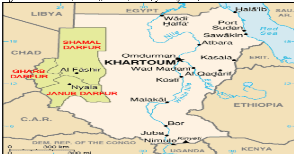
Fig. 1. Darfur Norte (Shamal), Oeste (Gharb) y Sur (Janub)

El detonante de los enfrentamientos armados actuales fue, a principios de 2003, el ataque del Ejército de Liberación de Sudán de Minni Minawi (ELS-MM) al aeropuerto de Al Fashir, capital de Darfur Norte. El ataque provocó la indignación del gobierno y, en respuesta, un contraataque aéreo del gobierno junto con el empleo de las milicias janjaweed . Por el lado de la distensión, el Acuerdo de Paz de Darfur (Darfur Peace Agreement , DPA), firmado el 5 de mayo de 2006 entre el gobierno de Sudán y el ELS-MM, debía poner fin a tres años de luchas fratricidas; pero a pesar de la reducción de los enfrentamientos “oficiales” entre los rebeldes y el ejército sudanés, lo cierto es que han aumentado los enfrentamientos tribales –incluso entre grupos que hasta no hace mucho tiempo eran aliados–, las acciones contra las fuerzas internacionales y la presión sobre las organizaciones de ayuda humanitaria. 3 Desde entonces, los enfrentamientos armados