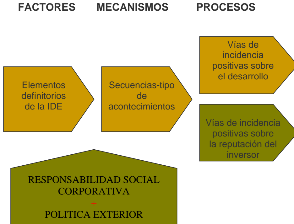
Gráfico 3. Influencia de la RSC y la política exterior en los resultados de la IDE

La medición de la incidencia de una inversión en el desarrollo deberá no sólo dar cuenta de los factores que concurren en la inversión y de los mecanismos que se desencadenan de forma natural, sino también de aquellos que tienen lugar gracias a la voluntad y la responsabilidad de la empresa y gracias al apoyo de la acción exterior del Estado.