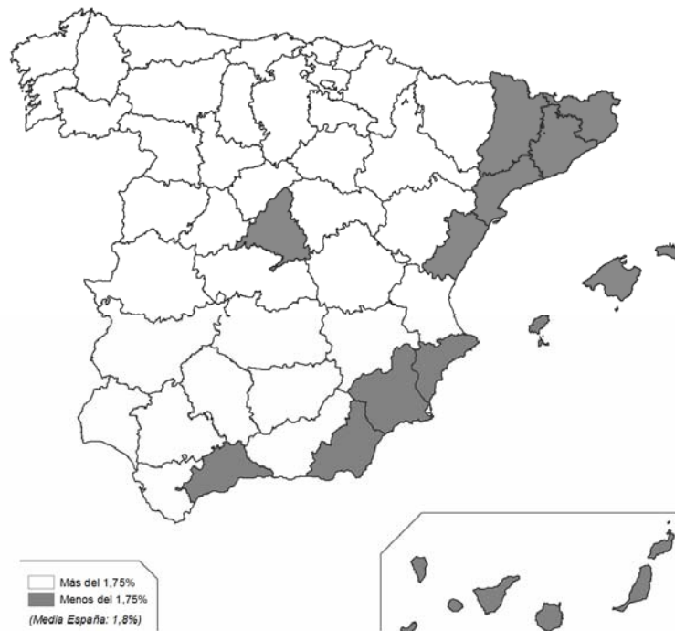
Figura 2. Los inmigrantes (residentes nacidos en el extranjero) como porcentaje de la población rural, 2000

Nota: consideramos municipios rurales los menores de 10.000 habitantes.