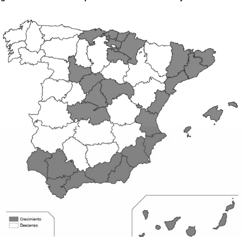
Figura 4. Evolución de la población rural entre 1991 y 2008

Nota: consideramos municipios rurales los menores de 10.000 habitantes.