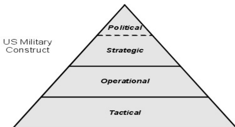
Cuadro 1. Paradigma del US Army para los niveles de la guerra

Por su parte, Bard O'Neill combina la clasificación de Kitson para conseguir una definición de insurgencia más precisa, y define insurgencia como la lucha entre las autoridades y grupos que intentan derrocar el poder establecido por medios políticos (propaganda, demostraciones de apoyo popular...) y violencia, con el fin de derrocar el poder y hacerse con el control del Estado. 26 Ambas definiciones identifican un actor, o subgrupo que intenta conseguir objetivos políticos por medio de la violencia, en la mayor parte de los casos por medio del terrorismo. Por lo tanto, podemos definir insurgencia como un movimiento organizado que intenta hacerse con el control de un Estado por medio de la propaganda, la guerra de guerrillas y el terrorismo.