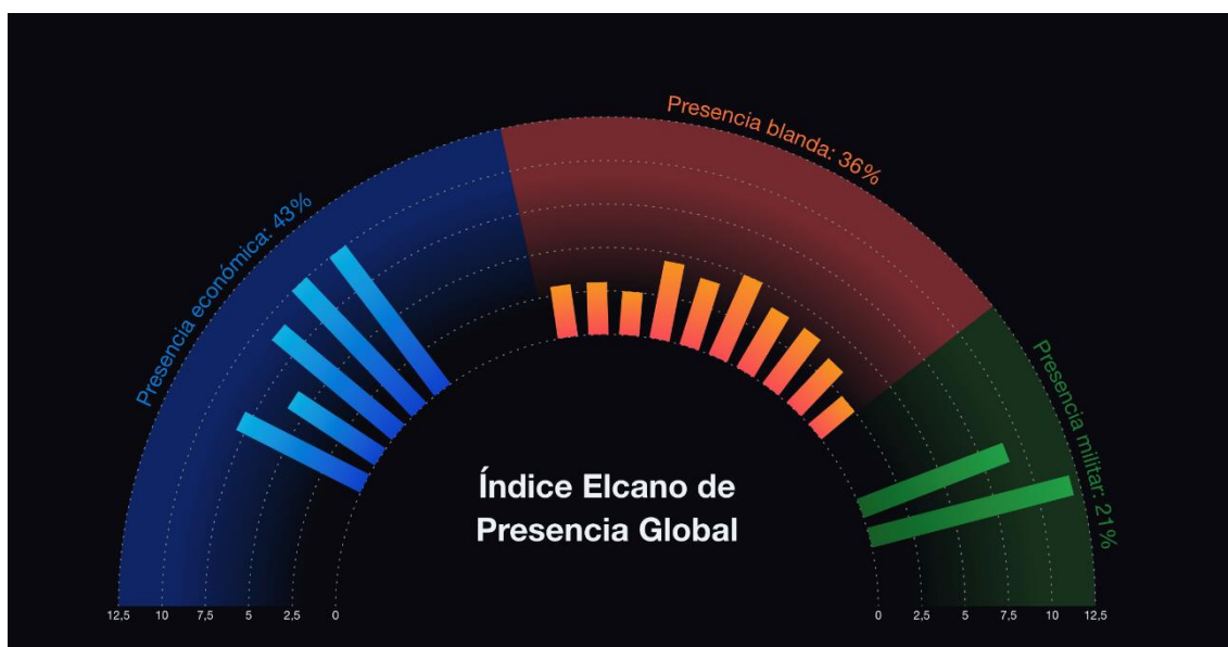
Figura 1. Índice Elcano de Presencia Global

El Índice Elcano de Presencia Global calcula la proyección de los países fuera de sus fronteras, en los ámbitos económico (energía, bienes primarios, manufacturas, servicios, inversiones), militar (tropas, equipamiento militar) y blando (migraciones, turismo, deportes, cultura, información, tecnología, ciencia, educación, cooperación al desarrollo y cambio climático) (Figura 1).